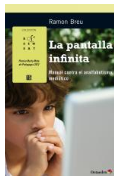
Educación infantil La pantalla infinita Ramon Breu Pañella